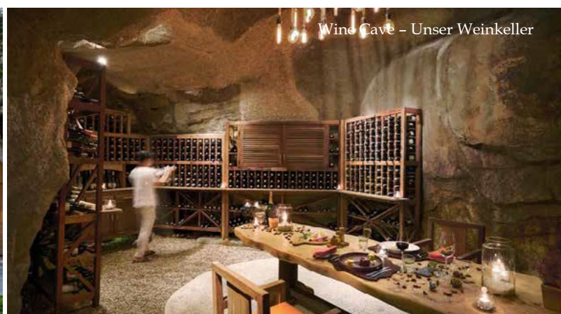
Wine Cave - Unser Weinkeller