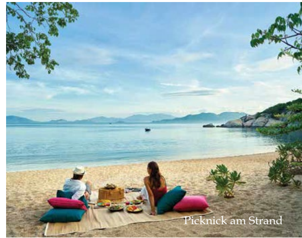
Picknick am Strand

Ein knospendes Hausriff schützt einheimische Fische und Korallen und erstreckt sich vom Experiences Center bis zu den Villen am Wasser. Ein beschrifteter Schnorchelpfad informiert die Gäste über die hier ansässigen Korallen und Meeresbewohner. Führungen auf Anfrage