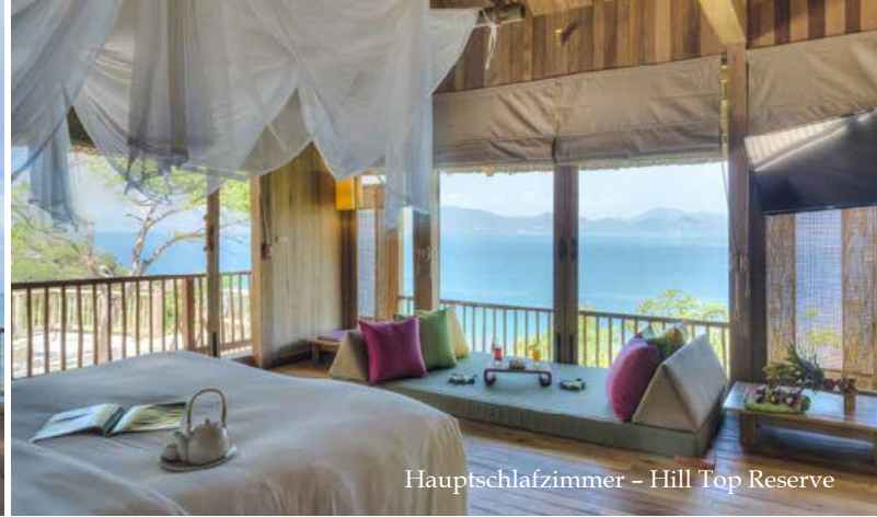
Hauptschlafzimmer – Hill Top Reserve