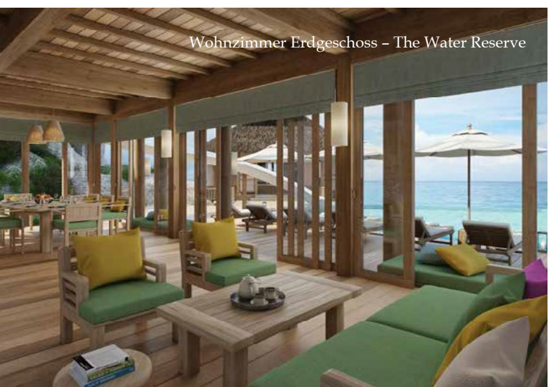
Wohnzimmer Erdgeschoss – The Water Reserve