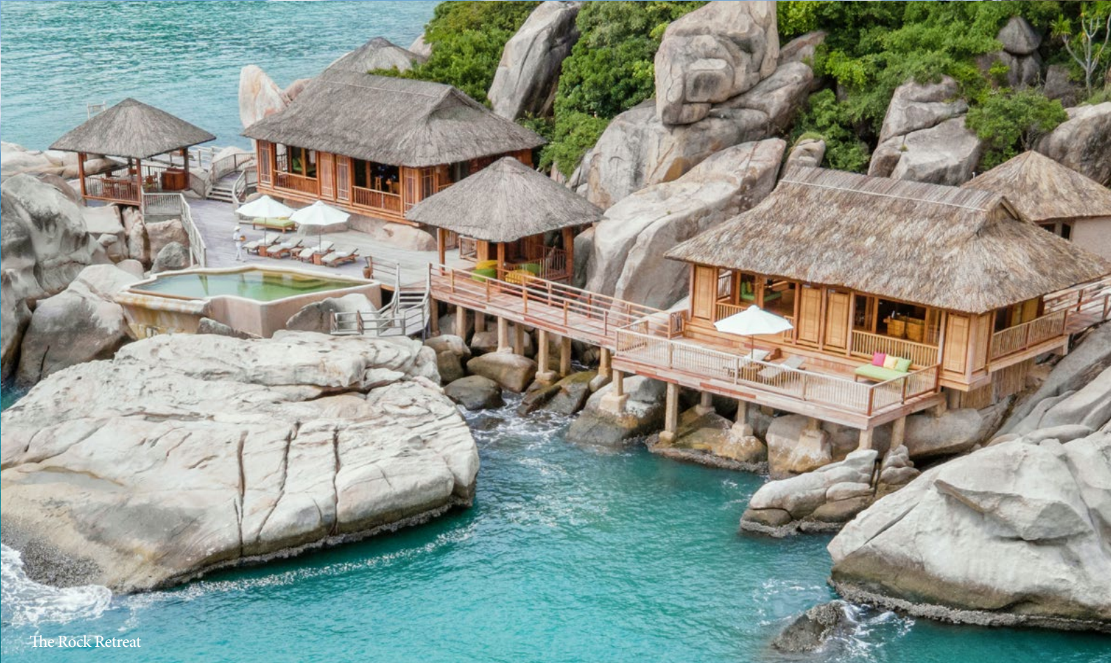
The Rock Retreat