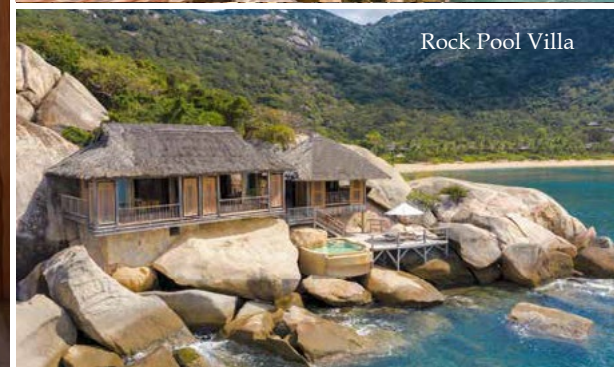
Rock Pool Villa