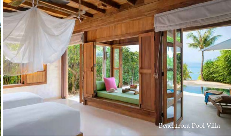
Beachfront Pool Villa