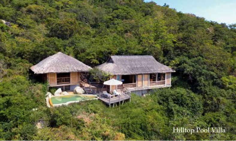
Hilltop Pool Villa