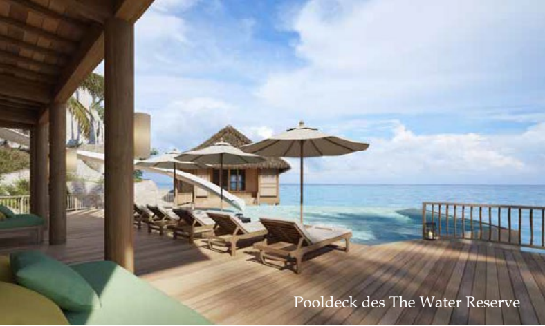
Pooldeck des The Water Reserve