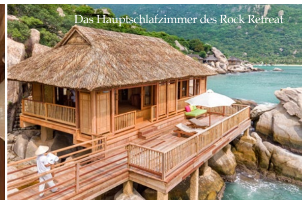
Das Hauptschlafzimmer des Rock Retreat