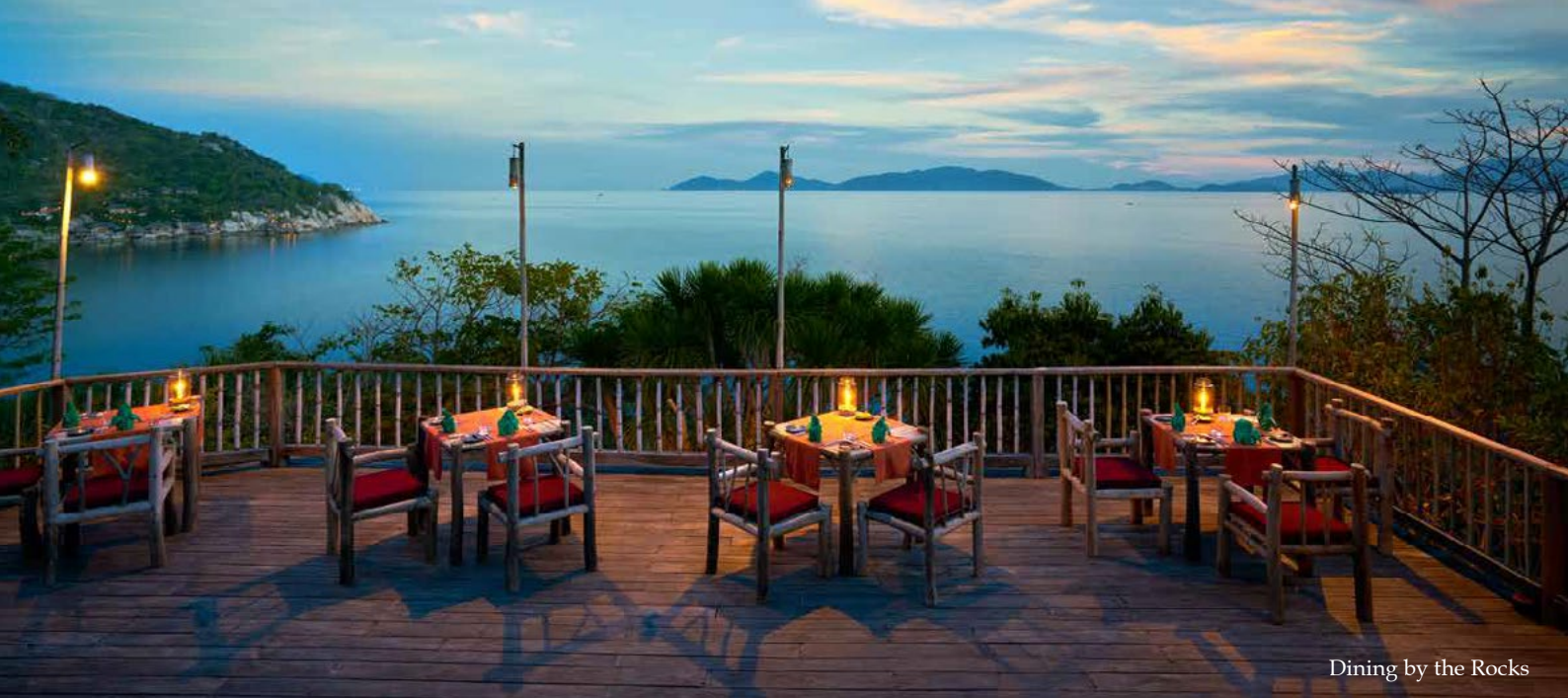
Dining by the Rocks