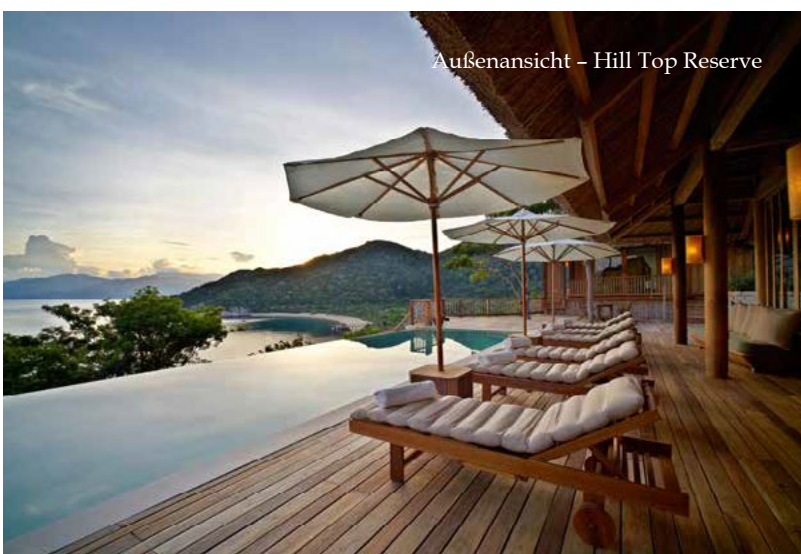
Außenansicht – Hill Top Reserve