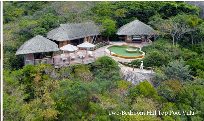
Two-Bedroom Hill Top Pool Villa