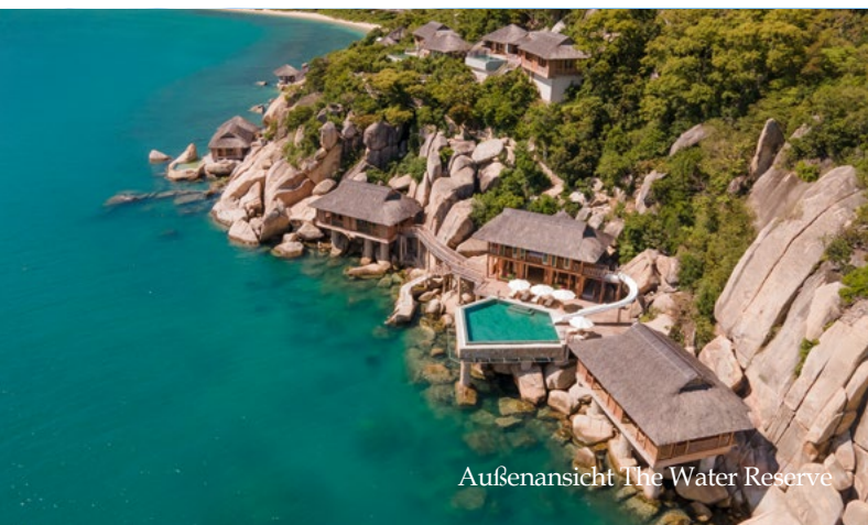
Außenansicht The Water Reserve