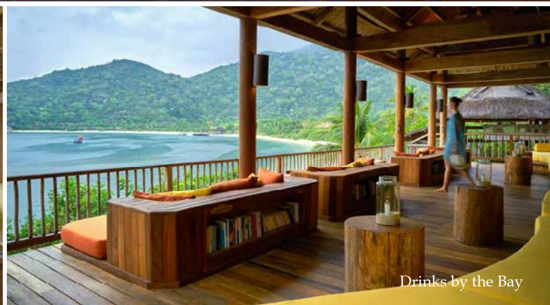
Drinks by the Bay