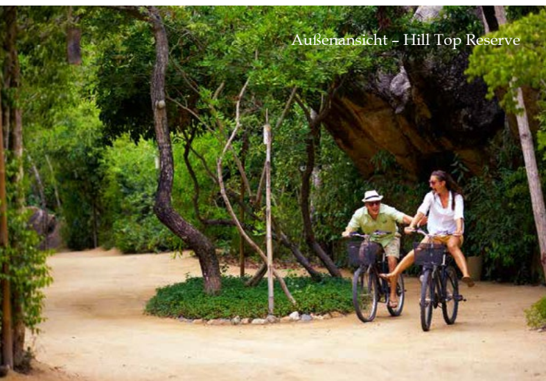
Außenansicht - Hill Top Reserve