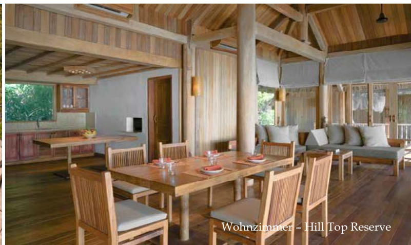
Wohnzimmer – Hill Top Reserve