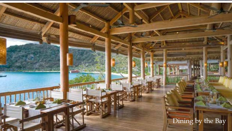
Dining by the Bay