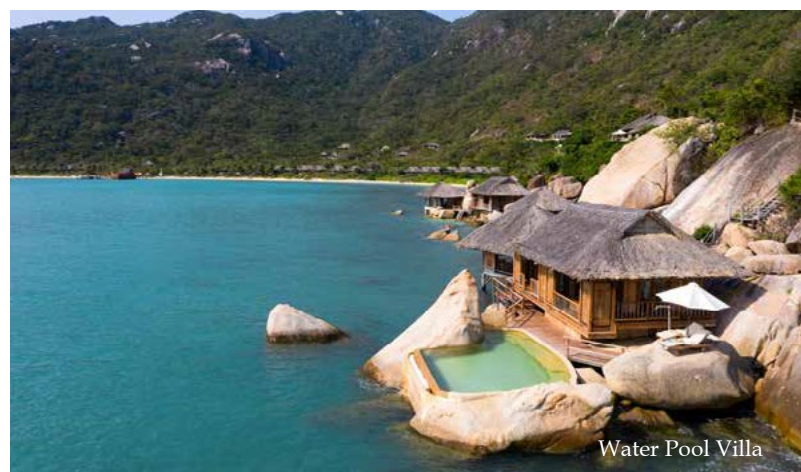
Water Pool Villa