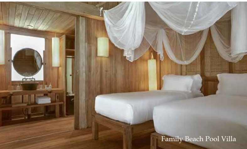
Family Beach Pool Villa