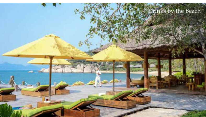
Drinks by the Beach

Diese Bar befindet sich neben dem Anleger und bietet direkten Zugang zum Strand. So können Sie nur wenige Meter von einem erfrischenden Drink entfernt die faszinierende Unterwasserwelt mit dem Schnorchel erkunden. Vier Netz-Liegen im Katamaran-Stil bieten einen einzigartigen Ausblick und Komfort. Am Abend werden hier mehrmals wöchentlich beliebte Filmklassiker gezeigt.